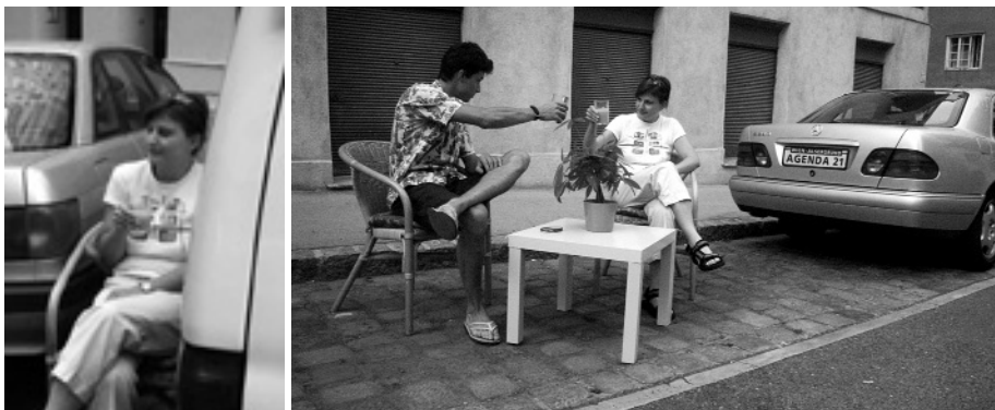
Für frei werdenden Parkraum haben wir bereits Ideen für alternative Nutzungen ...

träge des VCÖ (Verkehrsclub Österreich). Je nach Bedarf stehen Ihnen zwei verschiedene Typen zur Verfügung: Haben Sie bereits ein Auto, gibt es einen Mitbenutzungsvertrag, der Haftung, Abrechnung und das Verhalten bei Unfällen und