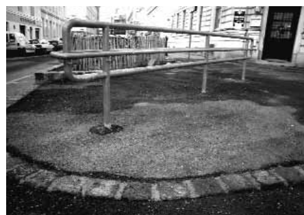
... ersetzt durch die Leichtigkeit der Ebene!

Auch was den Supermarkt in der Porzellanlangasse betrifft, gibt es gute Neuigkeiten. Bei einem runden Tisch im Sommer 2005 handelten die zuständigen Magistratsabteilungen mit der Bauabteilung des Supermarkts und der AGENDA 21 in der Bezirksvorsteherung eine einfache und kostengünstige Lösung aus: Eine Metallrampe am Eingang ist zur Genehmigung eingereicht und wird bald allen den Weg zum ungehinderten Einkauf ebnet.