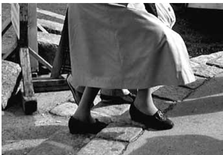
Die Mühen des Stiegensteigens ...

Die aktiven SeniorInnen aus dem Pensionisten-Wohnhaus Rossau sehen endlich ihren lang ersehnten Wunsch erfüllt: Der Weg vom Wohnhaus zum Donaukanal ist barrierefrei! Keine Stufen hindern die PensionistInnen mehr, den